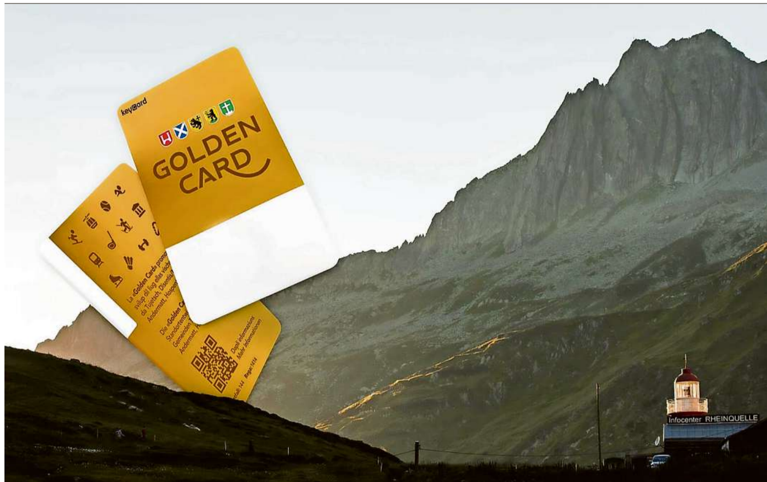
Fast wie die aufgehende Sonne inszeniert: Die Destination Andermatt-Sedrun-Disentis wirbt mit diesem Motiv vom Oberalppass für die «Golden Card».