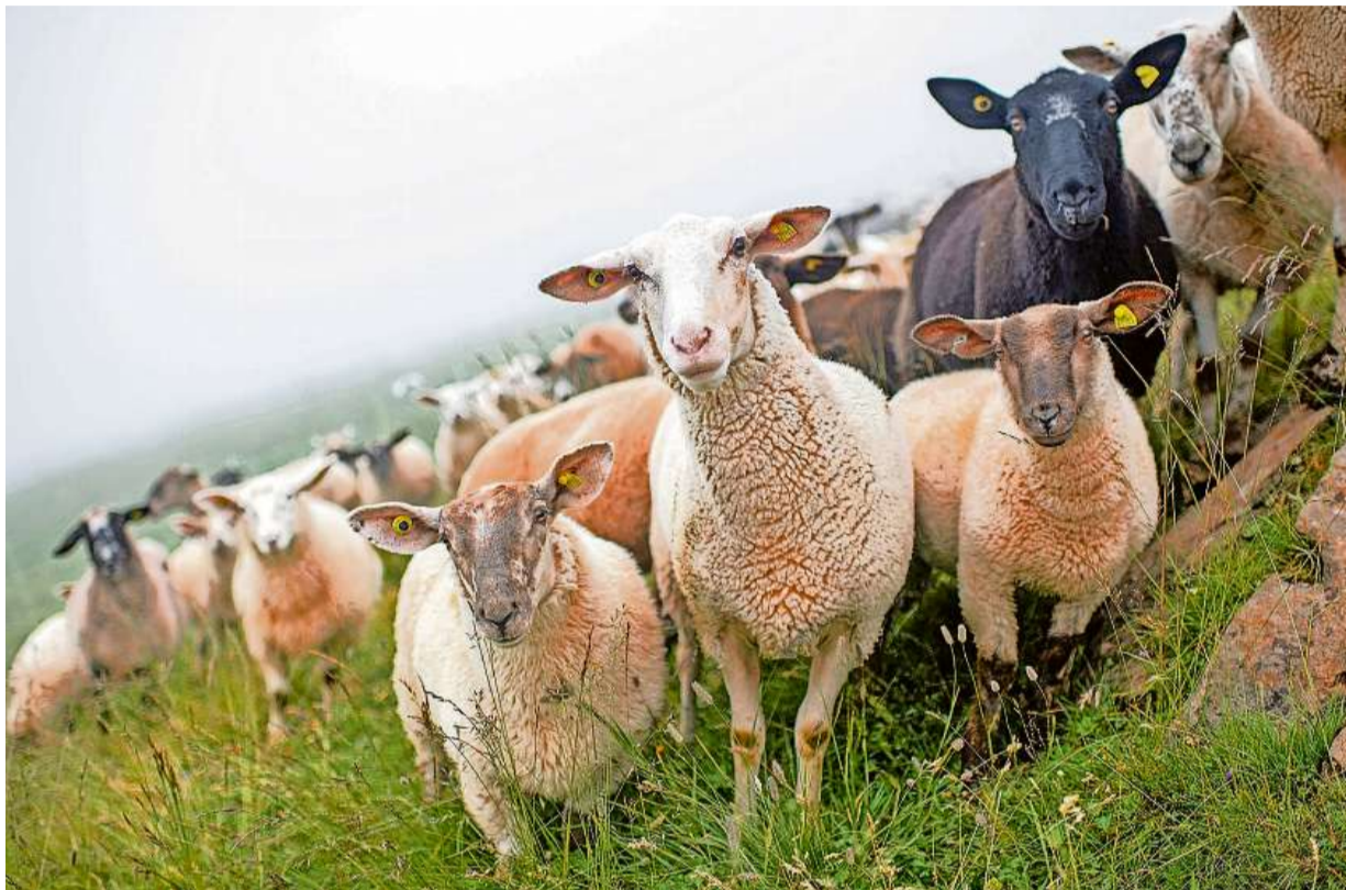
Geld gibts nur, wenn geschützt: Eine Schafherde weidet auf der Alp Culm da Sterls bei Trin.

Hintergrund für den politischen Vorstoss ist ein Vorfall auf der Alp Surtetta bei Sufers. Dort stürzten im ver-